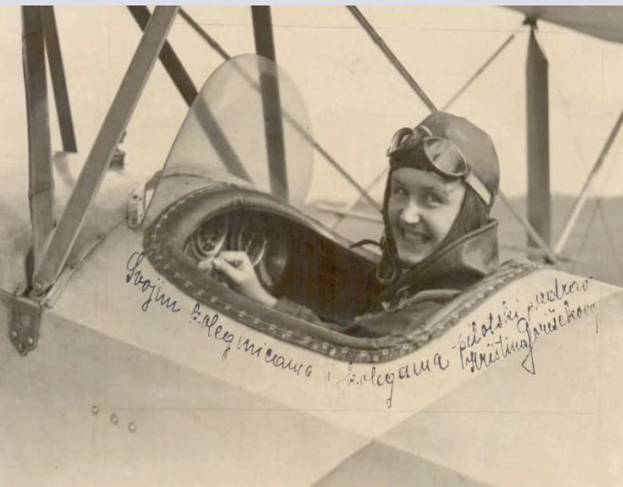
http://www.megaupload.com/?d=JOCR7Q9Q http://www.megaupload.com/?d=JOCR7Q9Q , (5. svibnja 2011.)